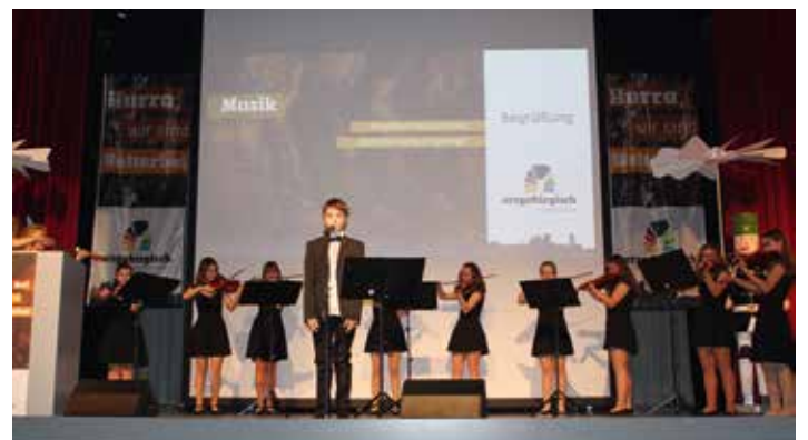
Das Amadeus-Pop-Orchester bot einen eigens geschriebenen Welterbetitel dar.

Um einmal herzlich Dankeschön zu sagen, gab es am Mittwoch, den 29. Januar 2020, in der Stadthalle Marienberg für alle Wegbegleiter, Unterstützer und Förderer, die in den anstrengenden, vor allem aber bereichernden letzten 20 Jahren auf diesem Weg mitgewirkt haben, eine Dankeschön-Veranstaltung. Der Nachmittag bot Gelegenheit, in Erinnerungen zu schwelgen und auch schon einen Ausblick auf Kommendes zu geben. Schließlich bietet der Titel nicht nur Chancen, sondern ist auch Verpflichtung. So wird der Welterbeverein als regionaler Träger in diesem Jahr mit eigenem Personal in die selbständige Arbeit gehen, um die vielfältigen Prozesse zu koordinieren. Wichtige Partner in der Zusammenarbeit bleiben u.a. der Förderverein Montanregion Erzgebirge e.V., der sich hauptsächlich um das Thema Vermittlung, Forschung und Beteiligung vieler Vereine und Bürger kümmern wird sowie der Tourismusverband Erzgebirge e.V., der für das gesamte touristische Marketing verantwortlich zeichnet. Vieles ist in Vorbereitung von Schulprojekten über Gästewerbung bis hin zu einem komplexen Beschilderungssystem. „Ab jetzt liegt nicht mehr die Konzentration auf: Wir wollen den Titel! – sondern auf der Motivation: Wir wollen etwas daraus machen!“, fasste der Landrat den Nachmittag zusammen.