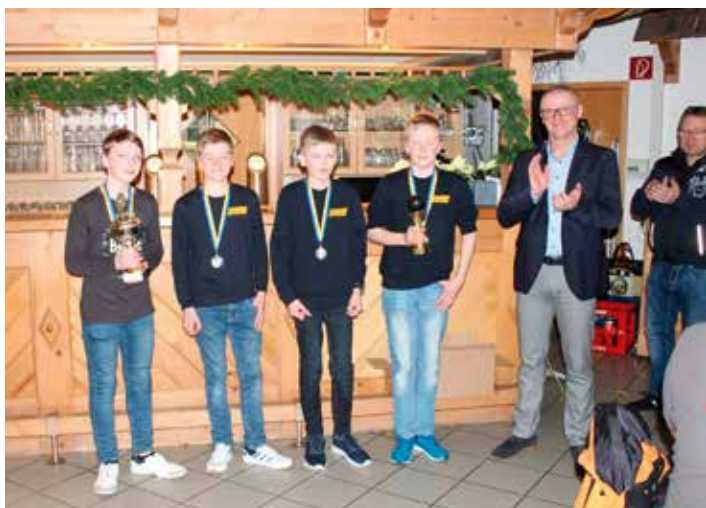
1. Platz: Jugendfeuerwehr Rübenau