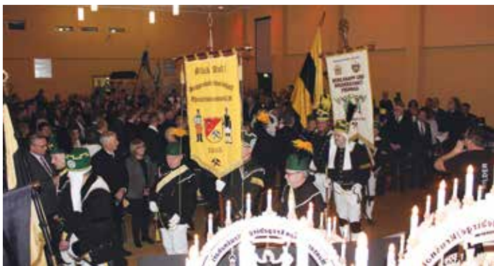
Der feierliche Einmarsch in die Stadthalle.

Was den Antrag betraf, ihre Heimat in die Welterbeliste aufzunehmen, waren sich die Erzgebirger mehr als einig. Obwohl die Idee anfangs auch bei den Verantwortlichen in der Staatsregierung nicht sofort auf offene Ohren stieß, wurde das Vorhaben zielstrebig verfolgt. Die Initiatoren meisterten den enormen Aufwand an Arbeit, um zu beweisen, dass sich ein Antrag lohnt und machten sich anschließend auf den Weg, das Ziel in die Tat umzusetzen. Mehr als tausend Menschen begleiteten aktiv den 20jährigen Weg der Antragstellung bis zum Titel „Montanregion Erzgebirge/Krušnohoří“. Menschen, die trotz Hürden und Widrigkeiten fest daran glaubten, dass diese Region etwas Besonderes ist. So besonders, dass sie Potential hat, den Titel „UNESCO-Welterbe“ zu tragen. Diesen Enthusiasten ist es zu verdanken, dass am 6. Juli 2019 in Baku/Aserbaidschan, zur Welterbetagung die positive Entscheidung fiel.