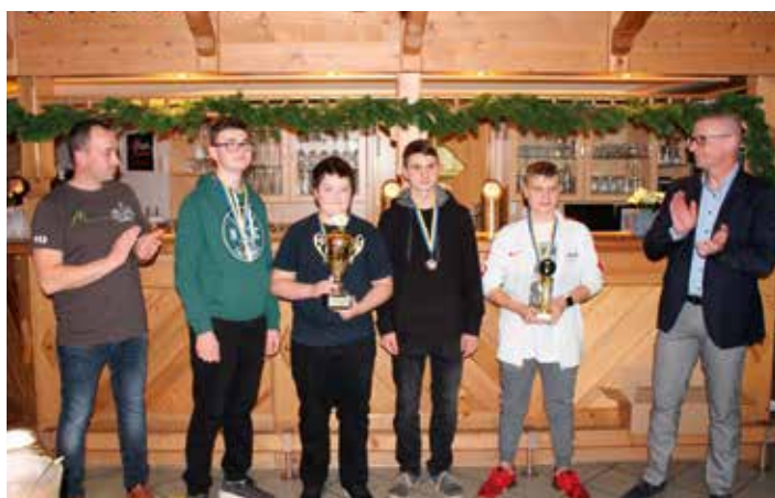
1. Platz: Jugendfeuerwehr Pobershau