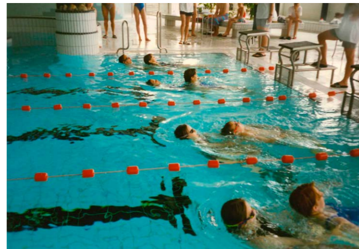
Sportwochenende 18.-20.07.1997, Wettkämpfe der Wasserwacht