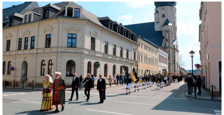
Nach dem Gottesdienst formierte sich der Bergaufzug in Richtung Zschopauer Tor