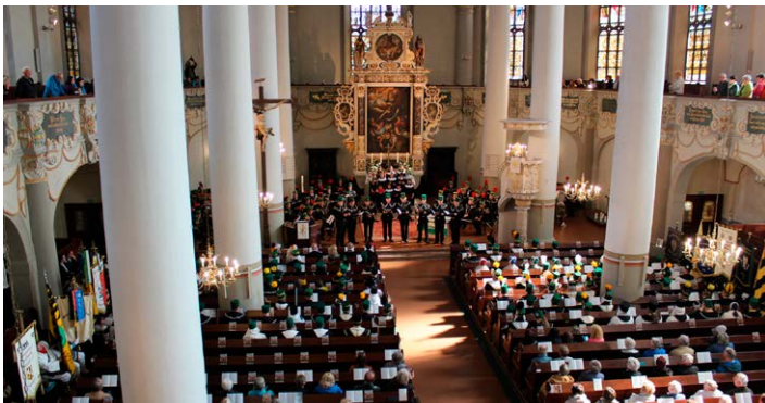
Mehr als 200 Trachtenträger sowie zahlreiche Gäste wohnten dem Berggottesdienst bei