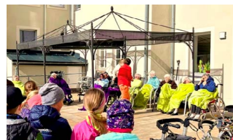
Übergabe in der Seniorenresidenz „Am Markt“ Marienberg