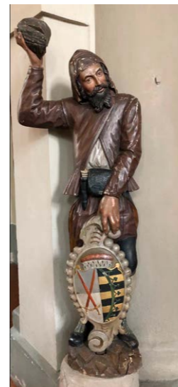
Bergmannsskulptur zu Füße des nördlichen Emporenpfeilers

In Abstimmung mit dem Landesdenkmalamt in Dresden wurde auf der Grundlage einer Befunduntersuchung über die Restaurierung der geschnitzten Bergmannsfiguren beraten. Dabei fiel die Entscheidung auf die fachliche Wiederherstellung der polychromen Fassung des 18. Jahrhunderts, welche in ihrer qualitativ hochwertigen Ausführung der hohen bildhauerischen Qualität beider Skulpturen entspricht. Zudem fügt sich die barocke Farbigkeit sehr gut in das Farbkonzept des ebenfalls nach historischen Vorbild restaurierten Kirchenraumes ein.