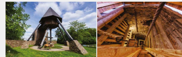
■ Ausstellung „Bergbau im Marienberger Revier“

Technische Vorführung des Pferdeköpels mit Pferden, Schacht untertage befahrbar, Bergschmiede, Scheidebank, Märchenberg