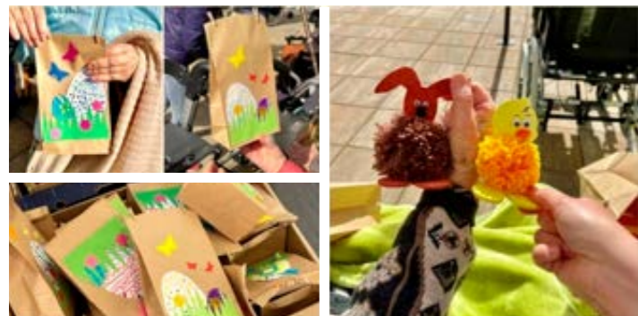
Übergabe im Diakonieverpflegheim „Hoffnung“ Marienberg

Unsere Grundschule startete in Zusammenarbeit mit dem Hort „Bunte Stifte“ die Aktion „Freude schenken“, um in dieser nicht ganz einfachen Zeit Senioren des Diakonieverpflegheimes „Hoffnung“ und der Seniorenresidenz „Am Markt“ zu Ostern zu erfreuen. Die Malereien und Basteleien sind kleine fantasievolle Kunstwerke, die unsere Schülerinnen und Schüler der Klassen 1 bis 4 gemeinsam gefertigt haben. Es entstand ein Ostergruß aus Holz mit bunt bemalten Geschenketüten und einer liebevoll gestalteten Karte. Die Übergabe wurde mit einem kleinen Programm begleitet. Das Ergebnis war überwältigend und den Bewohnerinnen und Bewohnern war die Freude förmlich ins Gesicht geschrieben.