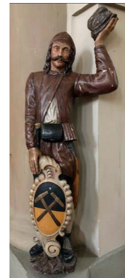
Bergmannsskulptur zu Füße des südlichen Emporenpfeilers