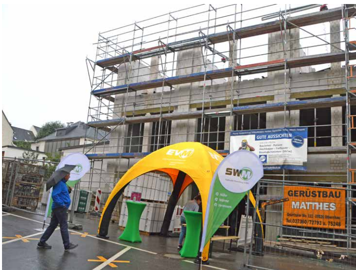
Die Energieversorgung Marienberg eröffnete den Besuchern Einblicke in die ehemalige Baldauf Fabrik.

Folgende Besucherzahlen zeigen, dass sich der Tag immer wieder großer Beliebtheit erfreut: