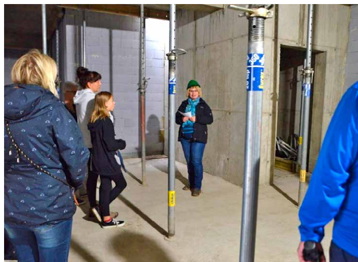
Bei einer Führung durch die Baustelle der ehemaligen Baldauf Fabrik konnten die Besucher den Baufortschritt begutachten.

Unter dem Motto „Sein & Schein – in Geschichte, Architektur und Denkmalpflege“ nahm auch wieder die Große Kreisstadt Marienberg an dieser Veranstaltung teil und zeigte Denkmale, die sonst nicht der Öffentlichkeit zugänglich sind. Zahlreiche Besucher nutzten die Gelegenheit, einmal einen Blick hinter die alten Mauern zu werfen.