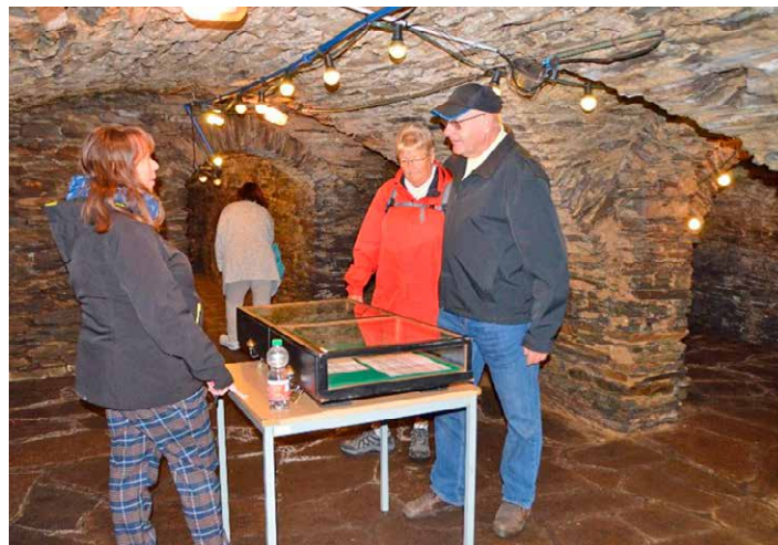
Im Keller des Rathauses erfuhren die Besucher viel über die frühere Nutzung des Gemäuers.

Zum 30. Mal öffneten an diesem Tag bis zu 8.000 Objekte in rund 2.500 deutschen Städten und Gemeinden ihre Türen.