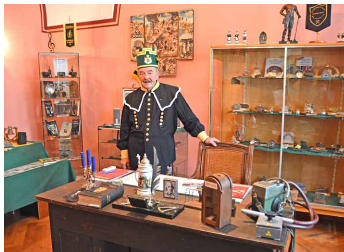
Im Trebrahaus konnte man sich eine kleine Bergbauausstellung ansehen.